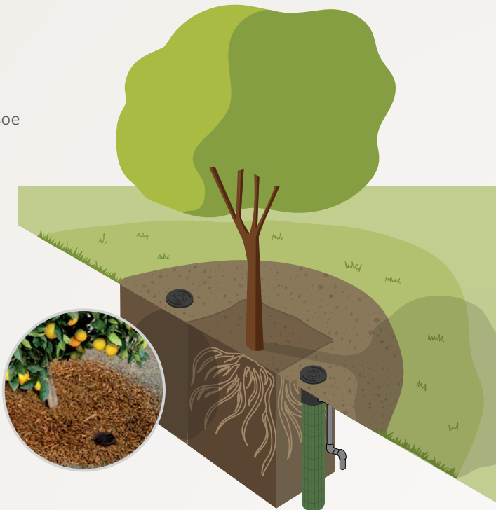
Система полива корневой зоны

Систему RZWS можно полностью отключить или дооборудовать выдвижными дождевателями для подачи требуемого количества воды к растущим деревьям.