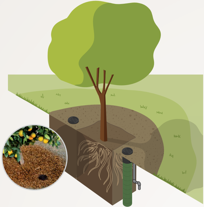
Bewässerungssystem für die Wurzelzone

RZWS kann jederzeit abgeschaltet oder auf Versenkregner umgerüstet werden, um die Bewässerung für ältere Bäume anzupassen.