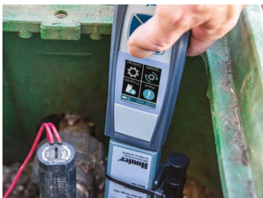
أداة تشخيص EZ-DT