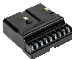
PCM-900 Высота: 7,5 см Ширина: 7,5 см Глубина: 3 см