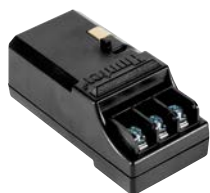
PCM-300 Высота: 7,5 см Ширина: 3,5 см Глубина: 3 см