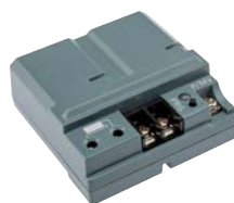
PC-DM Высота: 7,5 см Ширина: 7,5 см Глубина: 3 см