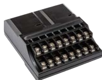
PCM-1600 Высота: 9 см Ширина: 7,5 см Глубина: 3,5 см